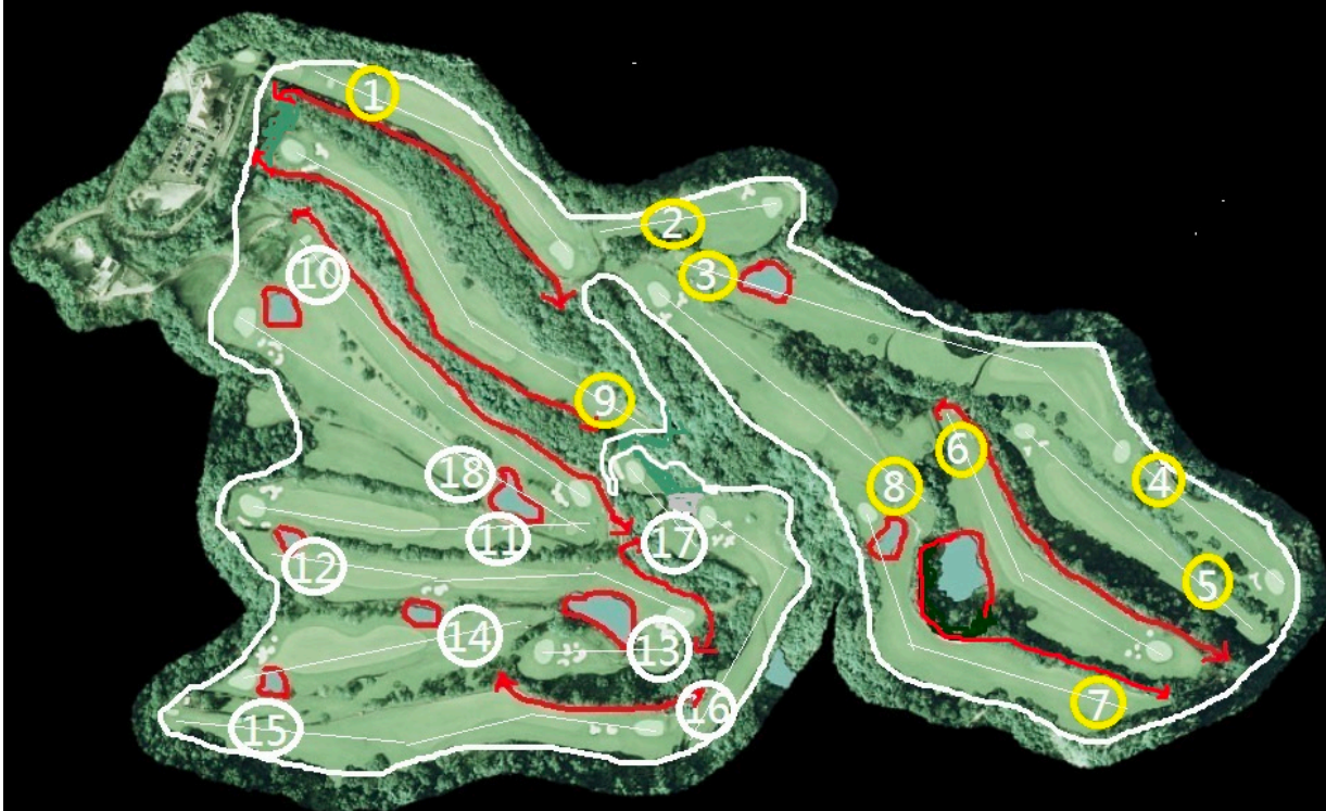
霧峰高爾夫球場 場地配置地形圖