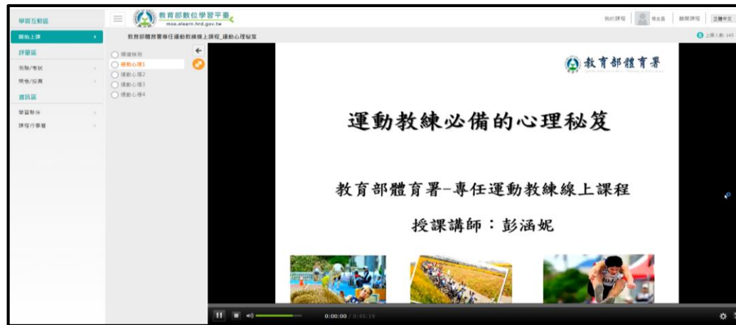
3.點選「上課」開始課程