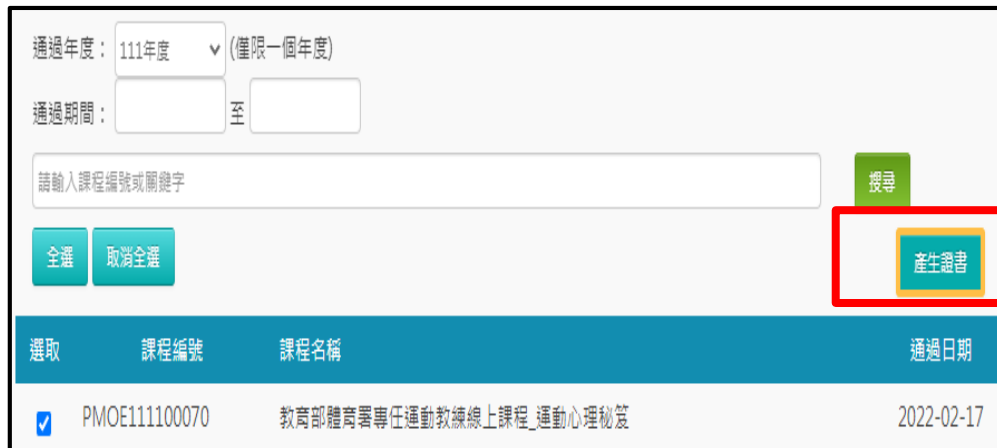
7.選取要列印的證書