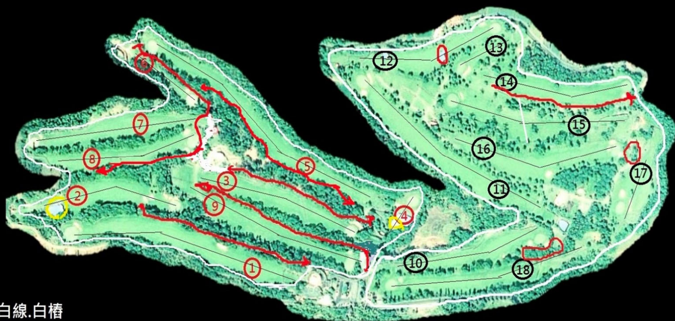
松柏嶺高爾夫球場 場地配置地形圖